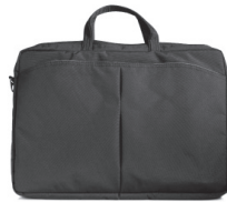
Sacoche ordinateur 34,00€