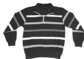
Pull homme 35,00€