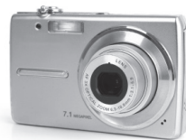
Appareil photo 69,00€