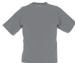
T-shirts tous styles 16,00€