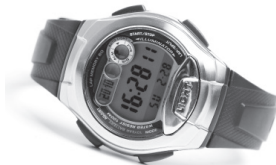
Montre 'Ice-Watch' 59,00€