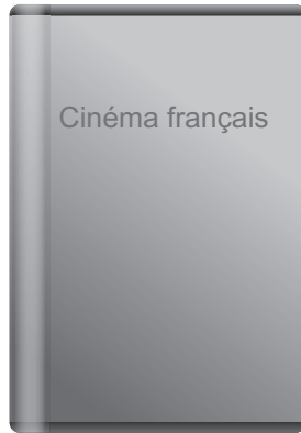
DVDs Collections cinéma français 10,50€