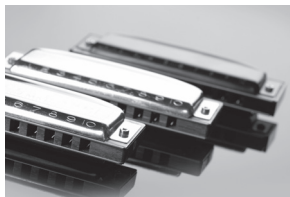
Harmonica Hohner 27,00€