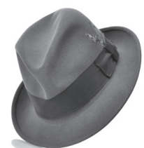
Chapeaux fedora hommes et femmes 69,00€