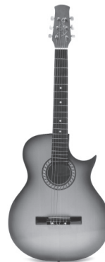
Guitare acoustique 49,50€