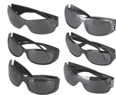
Lunettes de soleil 32,00€