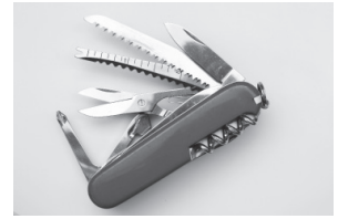
Couteau armée Suisse 38,00€