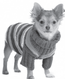
Pull pour chien 'Fifi' 18,00€